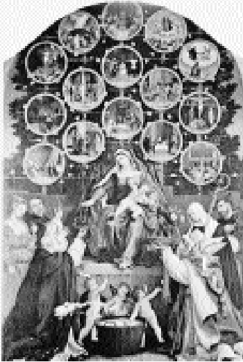
Lorenzo Lotto, Madonna del Rosario, 1539 , Chiesa di San Domenico di Cingoli, dove troviamo tematizzati tutti i Misteri.

A questo sarebbe bastata la memoria? Al pasto perenne sopra le acque che trascinano e salgono ad altro Giordano? Perché da quella notte fu capovolta la clessidra della salvezza.